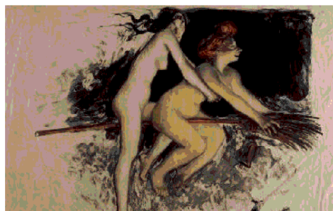
Jean Veber, Streghe moderne (litografia). Sotto, Louis Chalon, Circo (litografia)

Dopo avere pubblicato Etruscan Roman Remains in Popular Tradition (1892) e Legends from